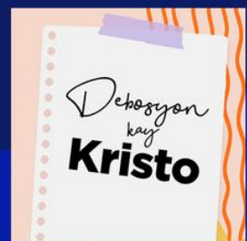
Debosyon kay Kristo