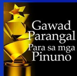
Gawad Parangal para sa mga Pinuno