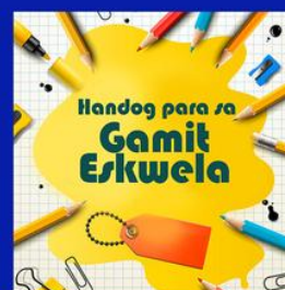
Handog para sa Gami-Eskwela