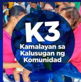
Kamalayan sa Kalusugan ng Komunidad (3K)